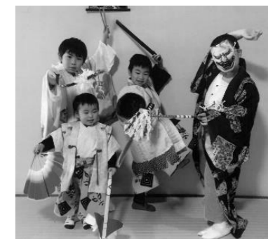
(出演 愛星子ども神楽)