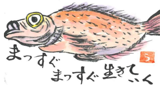
絵手紙「もみじ会」作品

行政相談は医療保険、年金、道路などいろいろな行政分野の幅広い相談に対応しています。 相談日 3月23日(金) 13:00 ~ 15:00 場所 八東支所 *予約はいりません