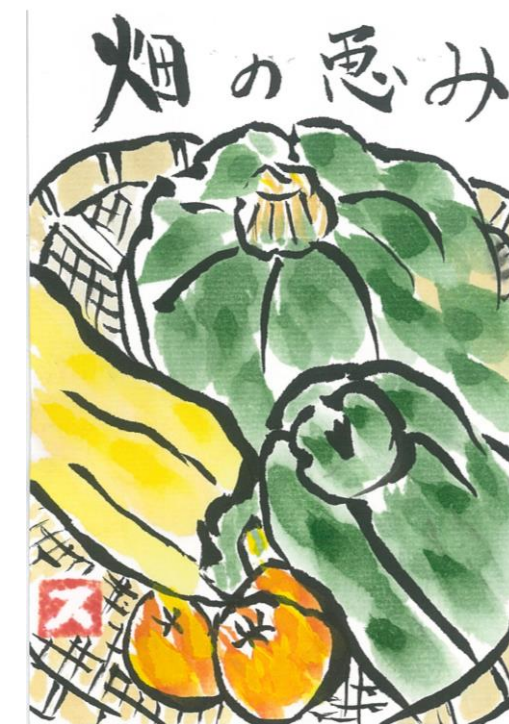
絵手紙「もみじ会」作品