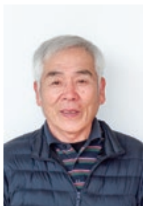
やつか桜の会 会長

2005年11月8日、宍道湖・中海が「ラムサール条約湿地に登録」されたのを契機に、松江市と旧NPO法人・斐伊川流域環境ネットワーク（通称：斐伊川クラブ）が、2007年4月から大根島