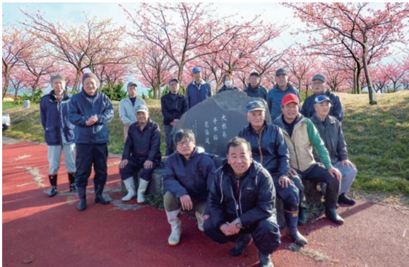
会員メンバー並びにボランティアの皆さん 石碑：『大根島千本桜花海道』の前で

この北西岸道路は毎日多くの車両が往来し、また「国宝松江城マラソン」コースの一部にもなりました。大根島は昔から牡丹の生産地であり、桜の名所地としても親しまれています。 「やつか桜の会」は、現在31名の会員（下記に記載）で桜木の育成・管理等を行っています。つきましては、現在 会員を募集 しています。多くの方の参加をお待ちしています。