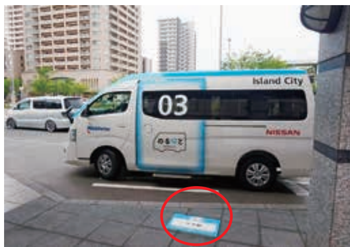
運行車両及び乗降場所

吉野…2025年には、個々に自家用車を所有する多くの団塊世代も繋がれば嬉しいですね。 ます。JR境港駅から予約すれば便利ですし、島内の名所めぐりや帰りにも利用できます。余談ですが、今私は大根島のいろいろな昔話の聞き書きを始めており、ライターとして、地元観光と昔話の聞き書き、又その情報をテーマにした企画を考えています。この度のAIデマンドバス運行が、地元の観光振興にも繋がれば嬉しいですね。