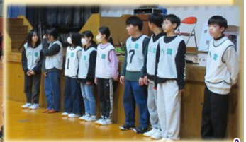
中学生サポーターに感謝!