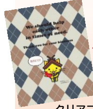
クリアファイル (1枚: 200円以上)