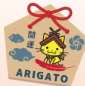
ピンバッジ (1個: 500円以上)