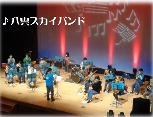
♪八雲スカイバンド