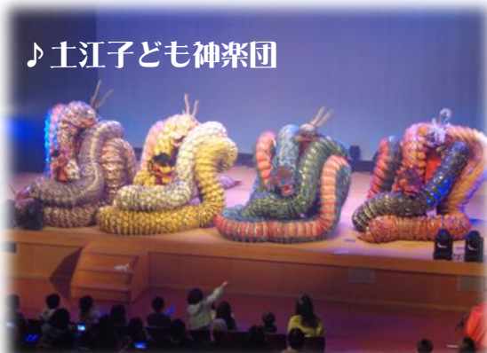
♪土江子ども神楽団