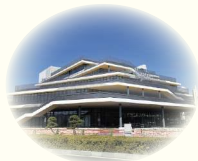
松江市役所新庁舎

公民館は、災害発生時には指定避難所となり、全ての市民にとって利用しやすい公民館となるよう環境整備が進められています。地域住民の拠点として公民館の果たす役割は益々大きくなっています。