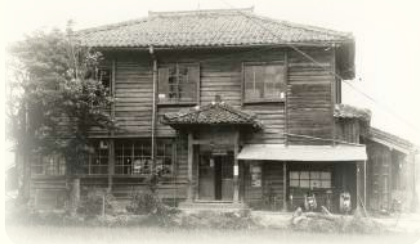
“松江市の第1号公民館” 旧・川津公民館(昭和27年)

松江市の公民館は、昭和27年(1952年)から市役所支所(旧役場)内に併設され、同年、川津ならびに竹矢公民館が市内の公民館として第1号の設置となった。以後、合併に合わせて支所・出張所あるいは学校に併設され、昭和35年には20公民館となりました。公民館の運営方式は、当初は直営でしたが、市の財政事情等により昭和41年から各地区の団体等で構成された公民館運営協議会の自主的な運営に委ねる公設自主運営方式へ移行することになりました。その後、地方自治法が改正され、松江市の公民館は平成18年9月から指定管理者制度を導入しています。平成17年に松江市と合併した旧八束郡の公民館も含め現在29公民館となりました。