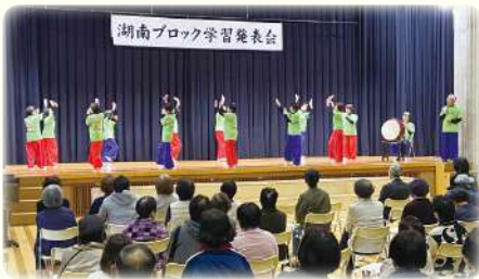
ブロック市民学習発表会

松江市の公民館は、市全域を5つのブロックに分け、市民学習発表会などブロック事業の企画・運営を行うことで、公民館相互の連携に取り組んでいます。