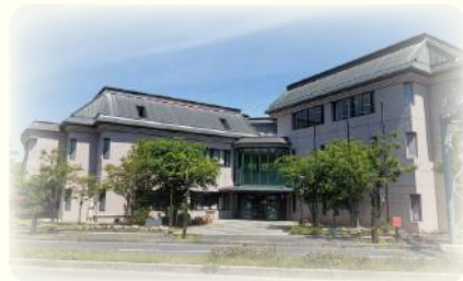
現在の川津公民館(令和5年)