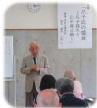
(昨年度の歴史講座から)