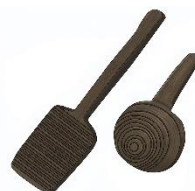
← 須恵器をつくる道具