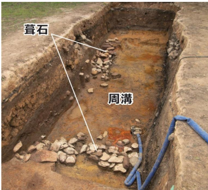
画像 1 調査状況の写真

また、周溝からは円筒埴輪や須恵器(古墳時代の土器)が見つかりま す。これらは付近に並べられていたものが落ちたと考えられ、古墳がいつ 頃造られたのかを知るための大変重要な手がかりとなっています。