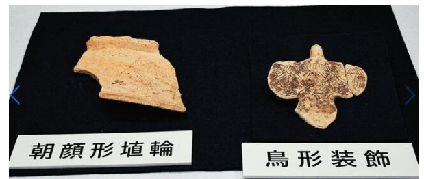
写真 ②出土した鳥形装飾と朝顔形埴輪