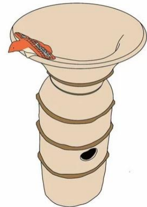
滑空する鳥形装飾付き朝顔形埴輪のイメージ図

竹矢では竹矢岩船古墳や手間古墳など、大橋川に面した位置に大型の古墳が点在しており、従来こちらの方に注目が集まっていたが、突如姿をあらわした竹矢公民館すぐ近くの八幡鹿島山古墳が、これからは注目されそうです。