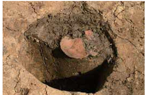
写真 柱穴から出土した中世の土器

八幡鹿島山遺跡ではこれまで縄文時代から古代までの遺物を紹介してきましたが、その後も続いていきます。この遺跡では円形の穴が300基近く見つかっています。複数の穴には中世の土師器(素焼きの小皿、かわらけ)が見つかっていますので、中世の複数の建物が存在したと考えられています。その中には柱を抜き取った後に土と一緒に土器を埋納したような遺構も見つかっています。これは建物を壊す時に行うマツリと考えられています。今でも、家を建てる際に行う地鎮祭や、井戸を埋める際に行うマツリなどは、このような儀式の名残と言えるでしょう。