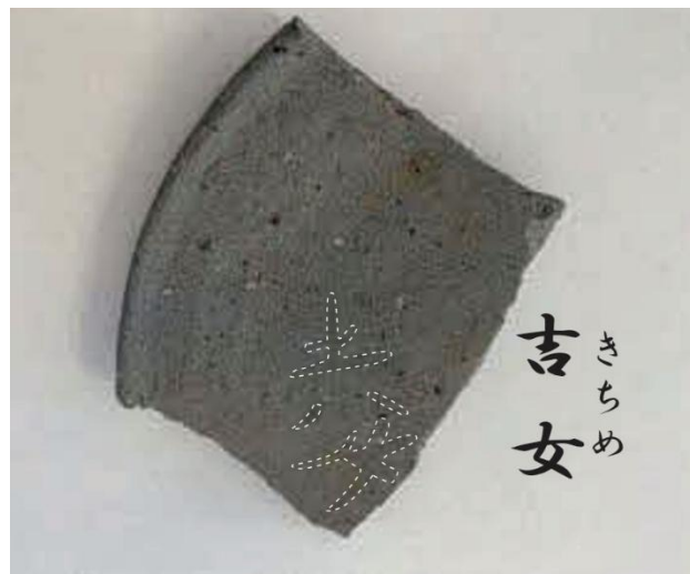
写真 見つかった墨書土器

この遺跡では、掘立柱建物の一部が見つかっています。東西2間(4.7m)×南北2間(5.2m)以上の建物で、調査区の外へさらに広がっていると考えられます。当時の建物としてもかなり大型のものです。女性の名前と考えられる墨書土器も見つかっています。墨書土器とは須恵器という種類の焼き物に、墨で文字を記したものです。「吉女」(きちめ)と読めるようです。