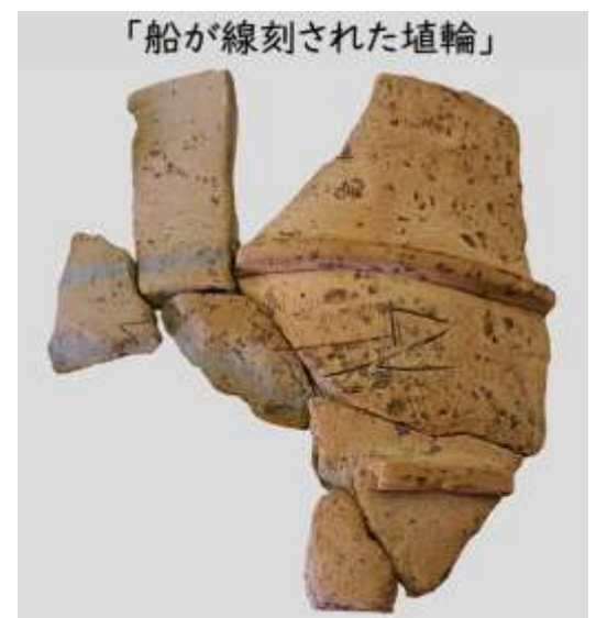
写真 見つかった線刻のある埴輪