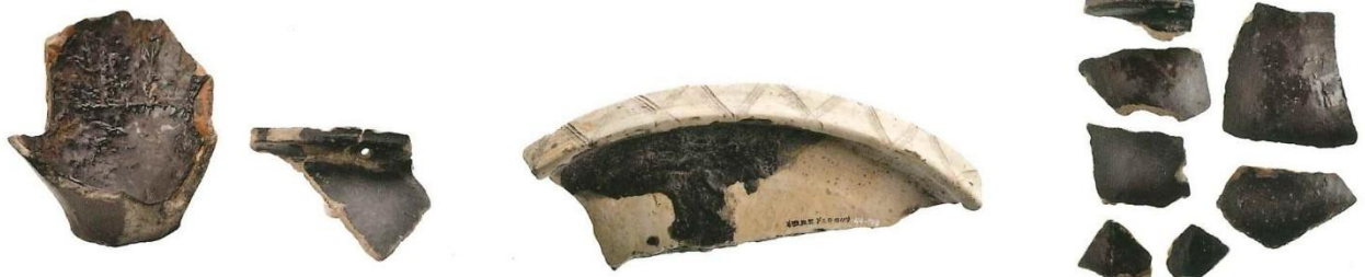
図 漆が塗られた土器

布田遺跡では黒く表面が塗られた土器が出土しています。これは弥生土器の表面に漆が塗られたものです。漆は縄文時代から利用されていましたが、塗料として表面に塗ったり、接着剤としての役割もありました。出雲では弥生時代を通じて、漆が利用されており、西川津遺跡などでも数多くの土器や木製品に漆が塗られてものが見つかっています。奈良、平安時代に入っていくと、美しく光沢のある漆は寺院などでも使われ、貴重なものとなりました。税として各地から都へも運ばれました。