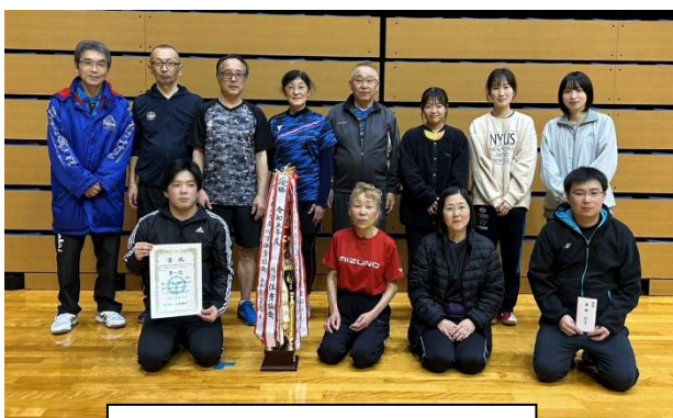
優勝を飾った選手の皆さん