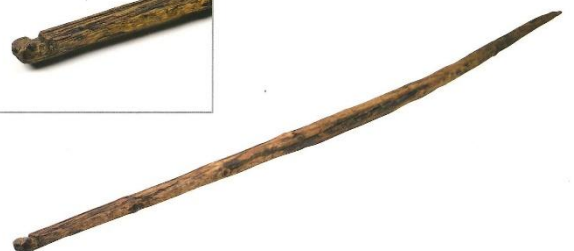
図 物を運ぶのに使われた天秤棒