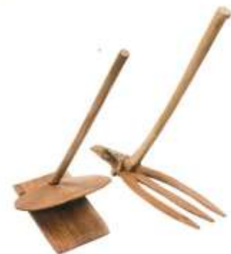
(参考) 17 木製鍬 (復元品)