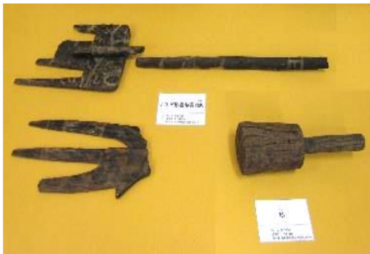
図 上小紋遺跡から出土した木製の農具

写真右下のものは横槌と言って、現在でも農家で使っておられるところもあるのではないのでしょうか。全く形が変わっていません。