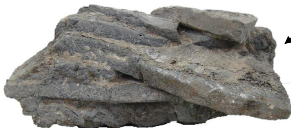
写真 中竹矢遺跡で発見された融着した瓦

写真はこの遺跡で発見された遺物です。平らな瓦が5枚ほど重なった状態となっています。これは瓦の焼成段階で融着してしまったもの、つまり失敗作です。須恵器などの焼き物も同じですが、このように焼く段階で残念ながら使用できない状態になってしまうものもありました。このような瓦は寺へは運ばれず、窯周辺に廃棄されてしまいます。これも窯跡特有のものであります。