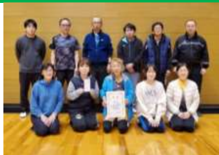
竹矢体協チーム選手の皆さん