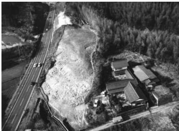
写真 オノ峠遺跡調査区

オノ峠遺跡は国分寺の北400mに位置し、国分寺や国分尼寺と同文の軒平瓦などが出土しており、関係が深いことが分かります。また国府にも近いので、寺院や役所に関係した人々の住居との見方が強いのです。