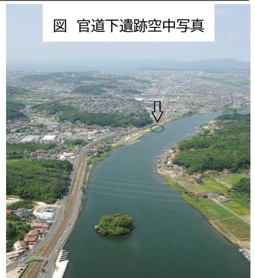
図 官道下遺跡空中写真

官道下遺跡は前回の灘遺跡の西側で、矢田の渡しの渡船場のすぐ横の遺跡です。すぐ南側に山がせまっており、山の上には石屋古墳があります。ここでも灘遺跡同様に、流路跡や河跡などが見つかかり、山から流れてきた遺物が多く見つかっています。また杭列があり棧橋状の遺構と考えられています。出土遺物には流路跡や河跡では縄文土器や須恵器が多く見つかっています。須恵器の年代は7世紀後半から8世紀前半と9世紀後半以降と考えられます。他に陶磁器類が多く見つかり、18世紀後半から出土量が増え、19世紀に入ると出土量が増えていきます。これは文政元年(1818)に68歳で死去した松平治郷(不味)の頃、松江藩の財政が好転したことと関係があり、それまで肥前系の陶磁が多かったものが、在地系の陶磁器や石見焼が主体となっていきます。