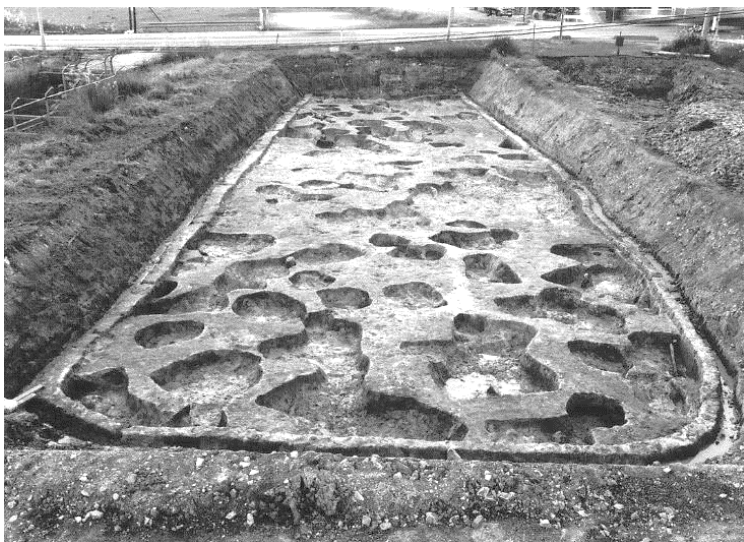
写真 中竹矢遺跡で発見された粘土採掘坑の跡

この辺りは白色粘土の層が確認されており、粘土を採掘した穴と考えられています。これらの穴からは、古墳時代前期～後期の土器が発見されているので、この時期に採掘されたと考えられています。付近には国分寺などへ瓦を供給した瓦窯跡も発見されていますので、良質な粘土が取れる場所だったのでしょうか。