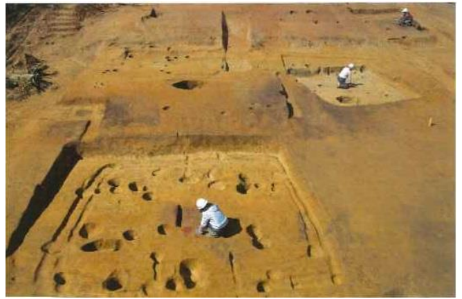
写真 見つかった竪穴式住居跡

奥宇田瀬遺跡は、内陸工業団地の西側の山で谷地形になった最奥部で発見された遺跡です。周辺の山一帯では開発にともない、南外古墳群、櫛岡古墳群などの発掘調査が行われています。奥宇田瀬遺跡の近くでは、近年まで水田が営まれていました。調査では竪穴建物、掘立柱建物、加工段、土坑、狩猟用の落とし穴が見つっています。竪穴建物は建て替えを含めて19棟も確認されています。なかには、須恵器の蓋坏、把手のついた須恵器碗、土師器のほか、水晶、石英、メノウの剥片や細片が出土している住居もありました。ここでは玉作りが行われ、6世紀前半頃のものと考えられます。狩猟用落とし穴は縄文時代のものと考えられます。