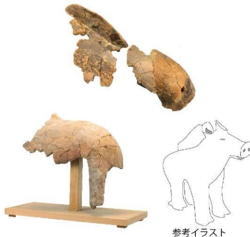
図 平所遺跡から出土した猪埴輪

1体はお尻から背中なたてがみの辺りまで。もう1体は大きく二つのパーツに分かれ、お尻の部分と背中なたてがみ部分です。動物の埴輪には馬や犬もありますが、犬にはたてがみがなく、馬は首が大きく上方にあがるため両者ではないことがわかります。あと馬は大きめの尻尾がつきますが、この埴輪には見られません。これらのことから、猪埴輪と考えられます。平所遺跡は窯跡なので、これらの埴輪を古墳に置いて、どのような場面をあらわす予定であったかは不明ですが、群馬県古墳の事例では人物と犬、猪が置かれ、狩人と獲物の猪、そして狩りの補助をする犬と考えられています。