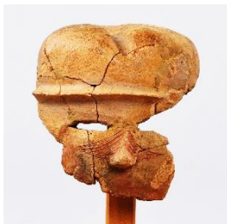
写真→ 刺青のある人物埴輪