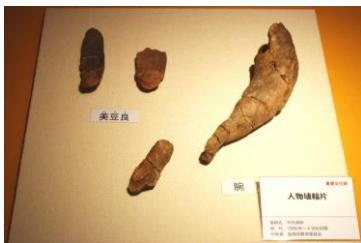
←写真 人物埴輪の腕、美豆良

という古代人の髪型を示す破片も展示しました。これは髪を中央で分け、耳の横でくくったものです。埴輪の破片は膨大にありますが、少しずつ調査を進めていきたいと思います。