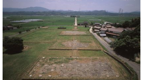
写真 北側から見た出雲国分寺跡(一番手前が僧坊)