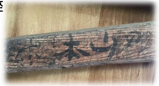
戸谷家敷地に残る旧大谷小学校の校舎 (牛小屋)の2階の梁に残る落書き

※2月16日(月)に予定していましたが、たまゆアカデミー 講座は講師の都合で2月19日(木)に変更になりました。