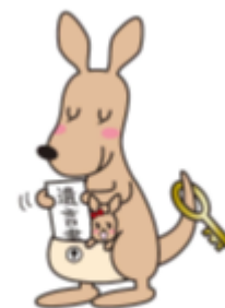
遺言書ほかんガルー