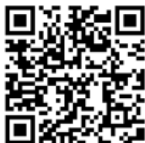
松江地方法務局ホームページのQRコード