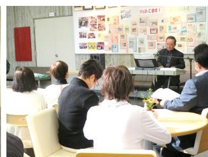
うたごえサロンの様子