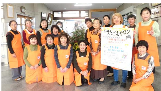
玉つばきの皆さん