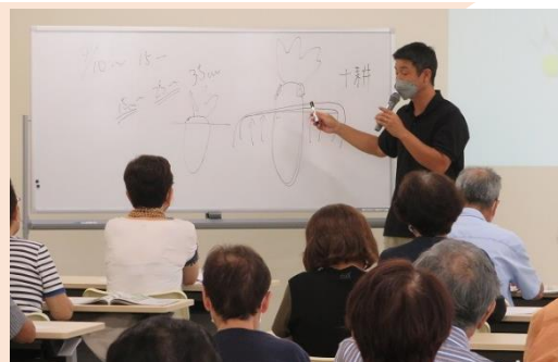
令和4年度講座の様子

花や野菜を育てるのが楽しみになる、実践してみたい と思えるお話です。会員の皆さまはぜひご参加ください。