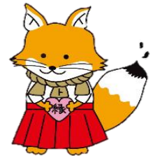
松江地方法務局不動産登記推進 イメージキャラクター 「縁結びトウキツネ」