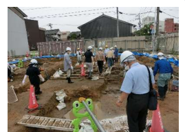
R5 発掘現場の現地説明会 和多見町にて

現在ほぼ松江市内各区域に設置されています「まち歩き案内板」は、平成21年度松江市で初めて白鷺地区に設置され、翌年には「街歩き あんない(マップ)」が発行されました。地域再発見の喜びを、まちづくりに繋げ活動してきた白鷺地区住民の皆さんや、その思いをつないで「白鷺まち歩き楽会」として活動された皆様の地域研究の成果と言えます。その「白鷺まち歩き楽会」が本年度末をもって閉会されます。これまで白鷺地区での歴史的資源の伝承・保全・活用の為に尽くされてきましたご功績に対し、心からお礼申し上げます。