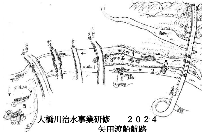
大橋川治水事業研修 2024 矢田渡船航路

矢田の渡して船を利用したのは高校生の頃だったか。毎日利用する知人もいました。矢田渡船のクルージングは本当に素晴らしかった。白い帆船が往来した古も、こんな眺めが大橋川周辺にもっと広がっていたのでしょうか。近い将来、松江大橋辺りから発着されて、多くの人がこの美しい風景に魅了されると良いのにと思いました。(M・M)