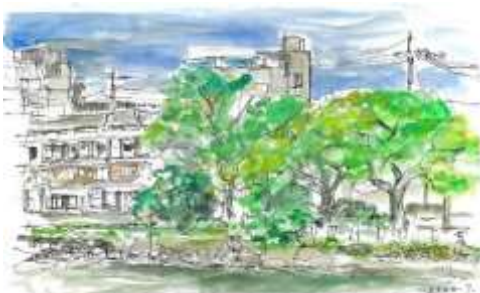
【松江大橋から】ビルが無くなり、見慣れた風景が変わります。

新しい生活様式での都市型マラソン大会とは?オンラインで開催する大会が少しずつ増えていて、GPSアプリを使っていつでもどこでも走っても良く、私は経験をしていませんが、今のこの時期モチベーションを保つために人気上昇とか。宍道湖岸か農道を一人で走っても、全国のたくさんの仲間とつながることができる。これからの大会の一つの在り方のようなのです。(M・M)