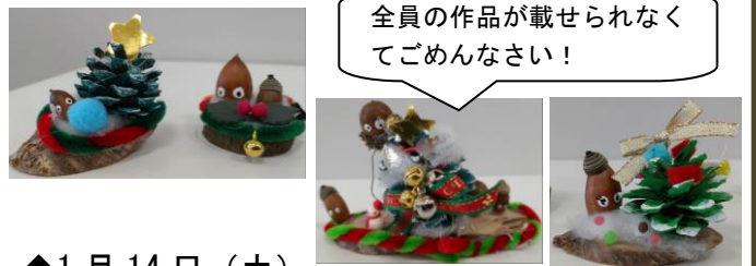
全員の作品が載せられなくてごめんなさい！

◆12月24日(土) クリスマスだから、クリスマスツリーのオブジェに挑戦！とってもかわいいツリーが完成しましたよ！