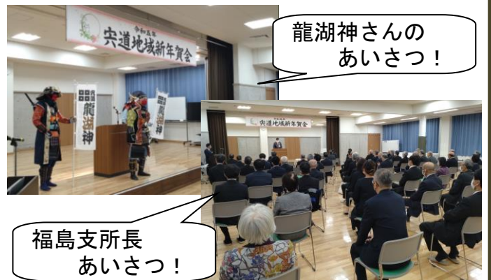
龍湖神さんのあいさつ！

2023年が明けた1月6日(金)に3年ぶりとなる「宍道町新年賀会」が宍道公民館において開催されました。宍道町の各種団体、産業界、商業界の皆様 70名程度の参加でした。コロナ禍の影響で乾杯や食事はありませんでしたが、令和5年度の宍道町の盛り上げ役となる「宍道芸術祭」や「古墳の森サバゲーPARK DANDAN」の活動報告などの紹介がありました。参加者は令和5年が輝かしい幕開けと共にすばらしい1年となることを願いました。