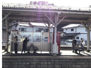
しんじ駅にて・・・