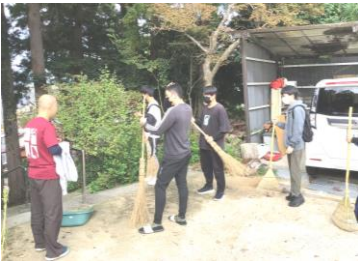
雲松寺にて・・・