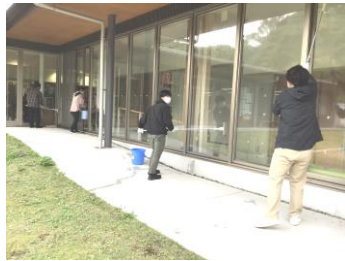
宍道公民館にて・・・