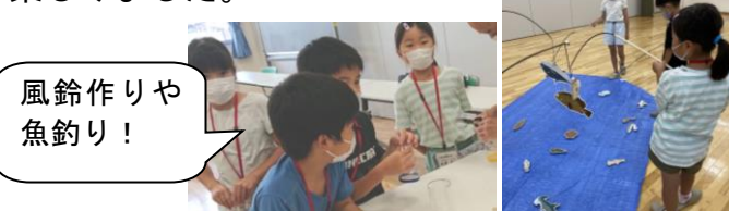
風鈴作りや魚釣り！

宍道体験まなび塾では、夏休みの間6日間に渡り、夏休み宿題集中講座として朝9時から自主学習をしました。1年生も集中して学習ができました。そのあと1時間はいろいろな遊びで楽しみました。