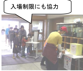
入場制限にも協力