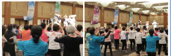
宍道町盆踊り保存会