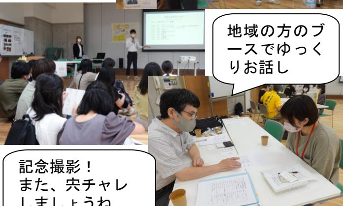
地域の方のブースでゆっくりお話し