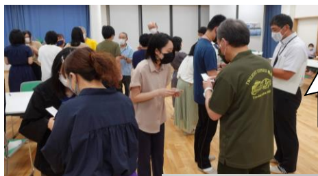
時計回りに名刺交換！

一生のうちに何らかの接点を持つ人が3万人、そのうち近い関係（同じ学校、職場、近所など）が3千人、さらにそのうち親しく会話を持つのが300人だそうです。これを思うと1日1人の人と出会っていることになるのでしょうか？「宍チャレ！」企画はこの日たくさんの方と出会えることが出来ました。一生付き合う可能性も秘めています。今日の出会いから何かが始まるかも・・・出会いを大切にしたいですね。