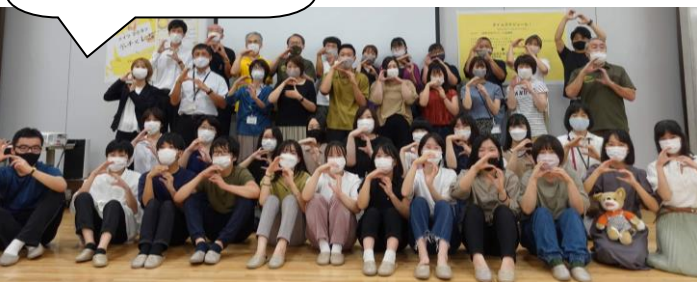
記念撮影！ また、宍チャレ しましょうね。