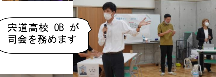
宍道高校 OB が司会を務めます