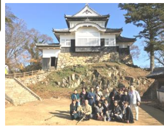
↑ 備中松山城を背景に集合写真

その後は、映画「八つ墓村」のロケ地で、巨大な富を築いた豪農の邸宅、広兼邸を見学。駐車場には懐かしのボンネットバスが停車中、学生時代を思い出し、乗りたくなる参加者もおられました。