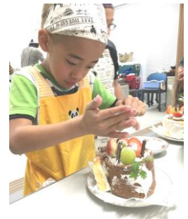
ケーキをデコレーション