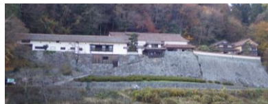
↓ 巨大な石垣が目立つ「広兼邸」