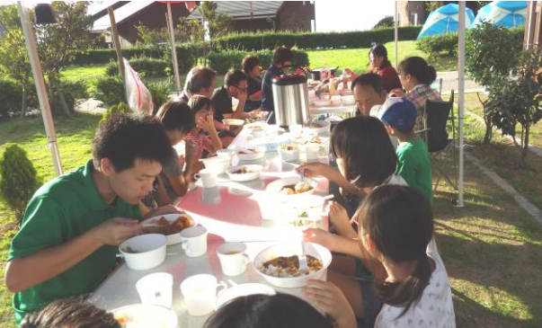
島根町の多古鼻へ子ども達とキャンプ。みんなで作ったカレーライスが格別の美味しさでした。