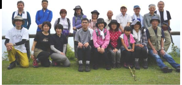
今年度から始まった穴道アウトドアクラブ。平田の旅伏山へ登りました。木の階段が多く大変な登山でした。