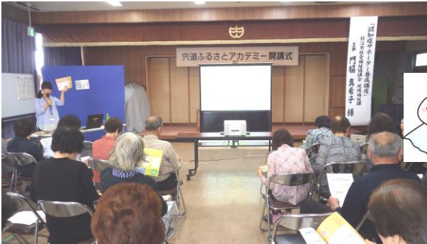
アカデミー開講式。認知症サポーター養成講座を行いました。