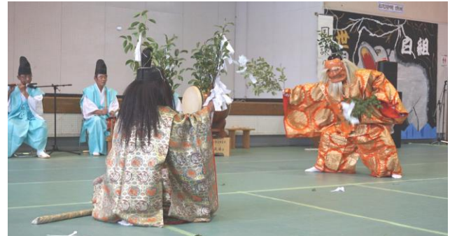
現在の公民館で最後の文化祭。思い出とともに素敵な展示・発表でした。