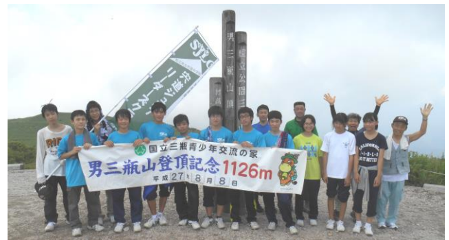
1泊2日で三瓶研修。初日はサイクリング、2日目に三瓶山(1,126m)へ登頂しました。