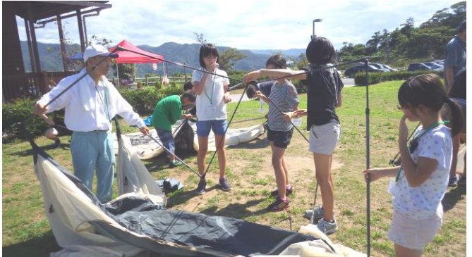
テントを立てるのに悪戦苦闘！スタッフと協力して立派なテントが完成しました。