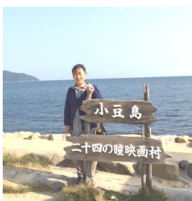
小豆島へ日帰り研修。天気も良く、寒霞渓をロープウェイで下りました。