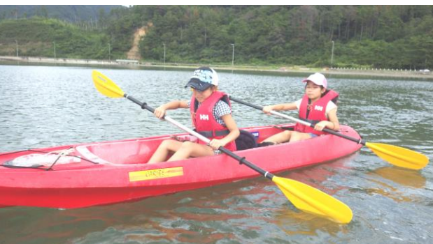
隠岐の島へ2泊3日の研修。隠岐の大自然で、シーカヤックなどを体験。