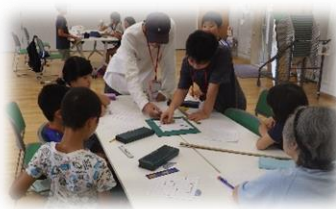
段ボールメイズの様子 8月19日