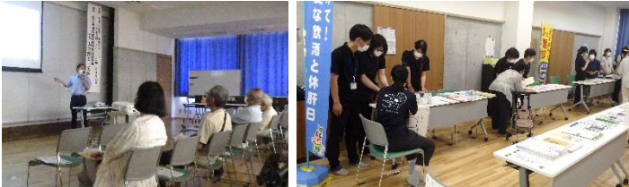
宍道地区社会福祉協議会・しんじワーキング倶楽部共催事業