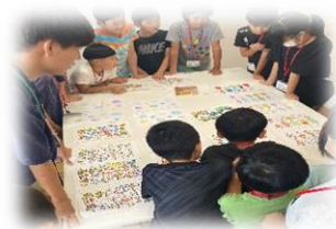
塗り絵マスターになるうの様子 8月20日