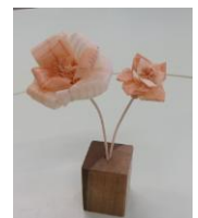
かんなくずアート

健康チェックコーナー 11:30~15:00 島根中学校体育館多目的ホール ベジチェック、口腔ケアチェック、測定・相談 ほか