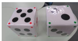
さいころシュート