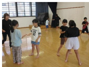
レクリエーションゲーム