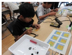
ものづくり教室 (高学年)