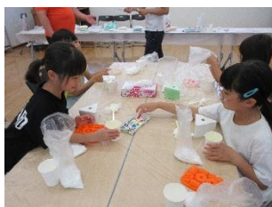
ものづくり教室 (低学年)

今年も小学校の夏休み期間に「さいかキッズクラブ」を開催しました。詳しくは公民館ホームページの『最近の活動』からご覧ください。