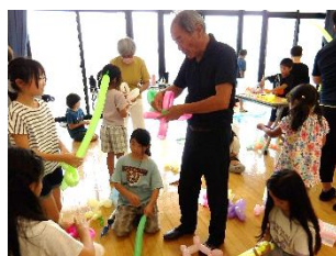
アートバルーン教室