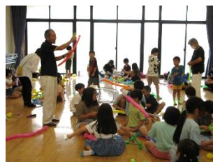
アートバルーン教室