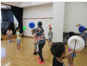
大道芸にチャレンジ!