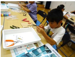
ものづくり教室 (低学年)

今年も小学校の夏休み期間に「さいかキッズクラブ」を開催しました。詳しくは公民館ホームページの『最近の活動』からご覧ください。