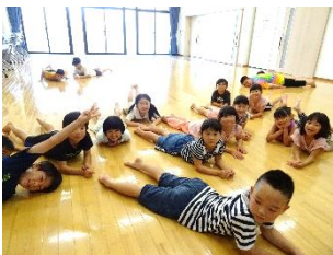
レクリエーションゲーム

今年も小学校の夏休み期間に「さいかキッズクラブ」を開催しました。詳しくは公民館ホームページの『最近の活動』からご覧ください。