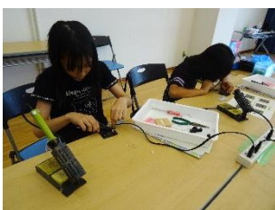
ものづくり教室(高学年)