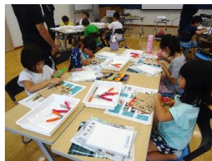
ものづくり教室(低学年)