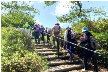
いき★いきウォーキング