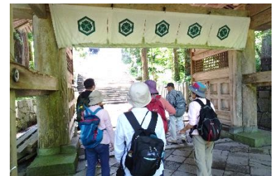
ハツラツさいか(歩こう会)