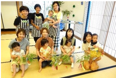
にこにこクラブ(乳幼児学級) 子ども広場(放課後子ども教室)

公民館報(全戸配布)にも掲載しています。また、公民館ホームページでも紹介しています。ぜひご覧ください!